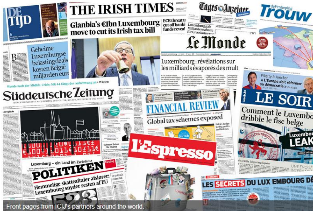
Front pages from ICIJ's partners around the world.

By Hamish Boland-Rudder, Leslie Wayne and Kelly Carr | November 19, 2014, 9:00 am