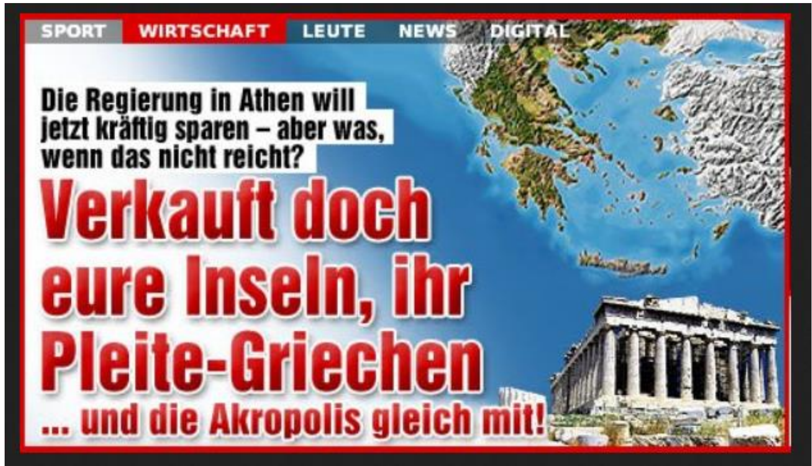
Bild contra Griechen