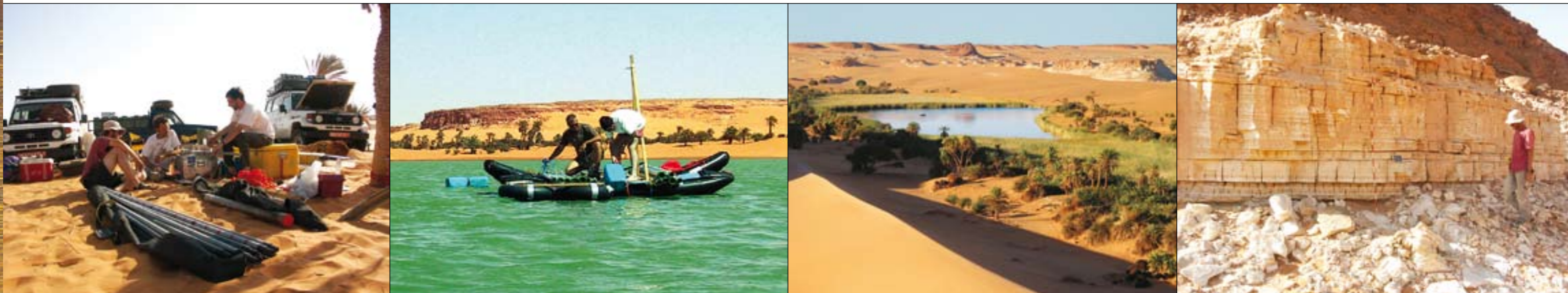
Lagerplatz in der Sahara: Mit Expeditionsfahrzeugen und schwerem Gerät sind die Forscher in den Tschad gekommen. Daneben: Auf dem Yoa-Salzsee von Ounianga Kebir wird eine Bohrplattform verankert. Die gewonnenen Sedimentkerne (links und rechts am Seitenrand) sind ein Spiegel der Klimageschichte.

Links: Der Boku-See, gespeist aus fossilem Grundwasser, im heute versandeten Becken von Ounianga Serir. Der Süßwassersee trotz seit 4000 Jahren der Austrocknung. Daneben: Massive Ablagerungen aus dem frühen Holozän.