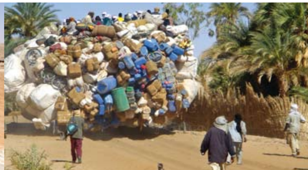
Stille Größe: Der 5,5 Quadratkilometer umfassende, salzhaltige Lac Teli von Ounianga Serir. Einst befanden sich die Inseln mindestens 50 Meter unter Wasser. Unten links: Der Autor mit einheimischen Honoratioren. Rechts: Ein überladener LKW erreicht nach einer Irrfahrt durch die Sahara das Forscherquartier.

bis 10000 Jahren. Die einzelnen Sedimentabfolgen sollen später mit dem Klimaarchiv des Yoa-Sees von Ounianga Kebir verglichen werden.