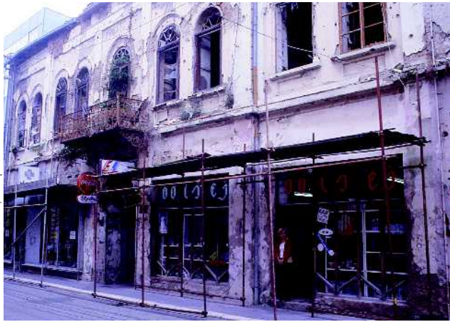
Hauptstraße von Vukovar