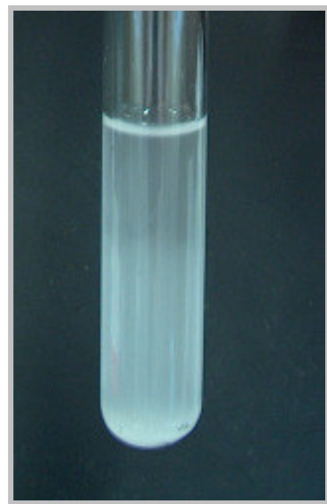
Chlorid-Ionen ( \text{Cl}^- ) weißer Niederschlag