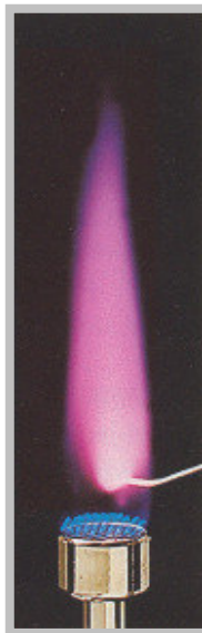
Kalium-Ionen ( \text{K}^+ ) rot / violette Flamme