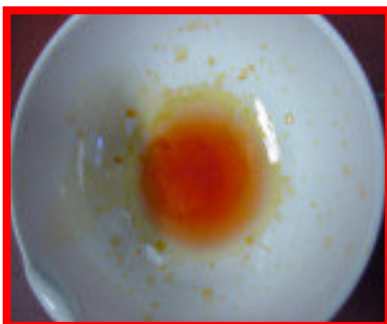
Magnesium-Ionen ( \text{Mg}^{2+} ) roter Niederschlag