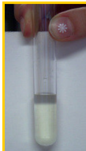
Phosphat-Ionen ( \text{PO}_4^{3-} ) gelber Niederschlag