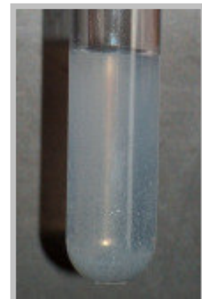
Calcium-Ionen ( \text{Ca}^{2+} ) weißer Niederschlag