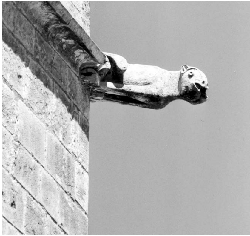
Schwerter zu Pflugscharen, Überwachungskameras zu Wasserspeiern.

Mit Chipkarten in den freiwilligen Überwachungsstaat