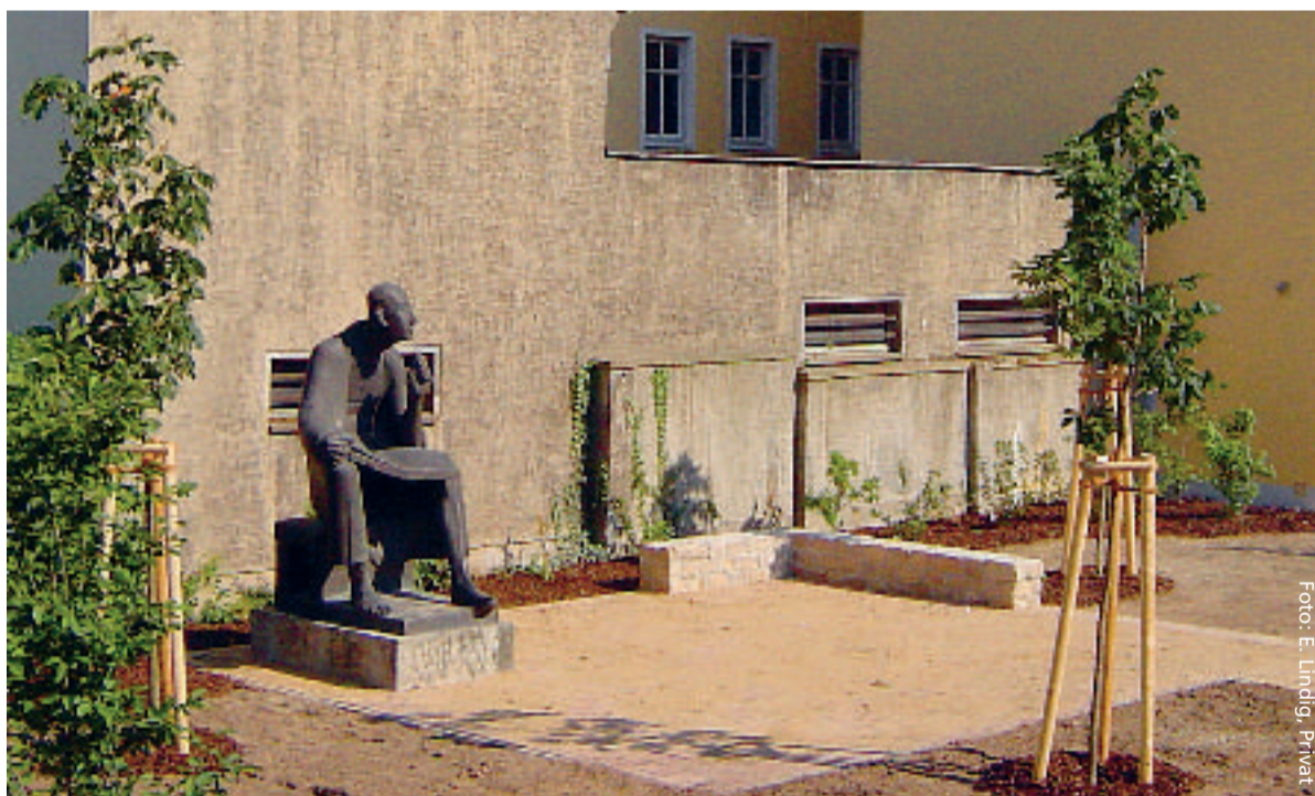
Albertus Magnus im Osten – im Garten der Universität Jena

Knapp neun Jahre später (März 1965) zeigte die Universität in Bogotá (Kolumbien) Interesse an der Albertus-Magnus-Statue. In Verbindung mit einer baulichen Neugestaltung sollte sie einen gebührenden Platz auf dem kolumbianischen Campus finden. Sowohl Gerhard Marcks als auch der damalige Hauptausschuss der Stadt Köln und das Kuratorium der Universität zu Köln zeigten sich einverstanden. Der bronzene Albertus Magnus machte nun also das erste Mal als Kopie seiner selbst eine Reise rund um die Welt.