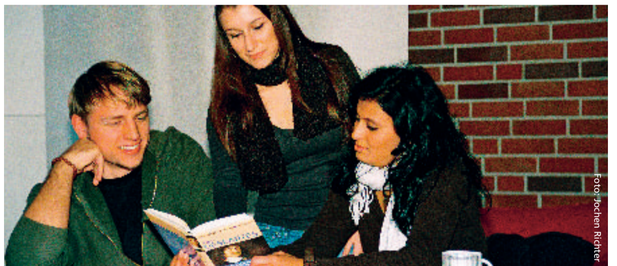
Die Auseinandersetzung mit Sinn- und Wertefragen ist Teil jugendlicher Entwicklung.

Bei dieser neuen Form der Zusammenarbeit zwischen Schülern