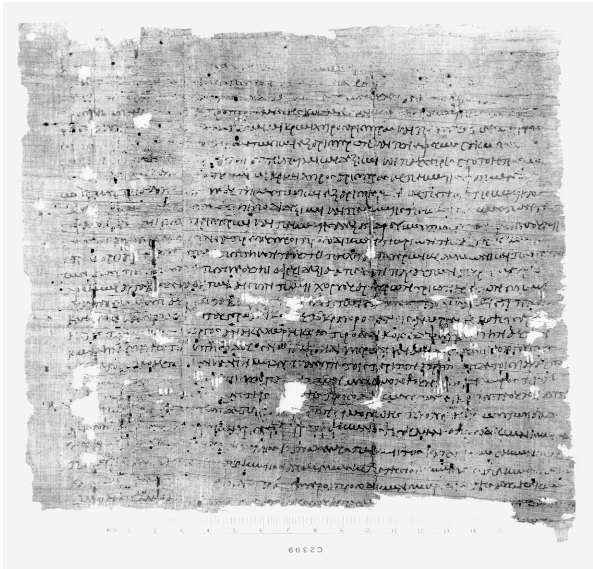
Quittung für τμή χόρτου (P.Mich.Inv.Nr. 204)