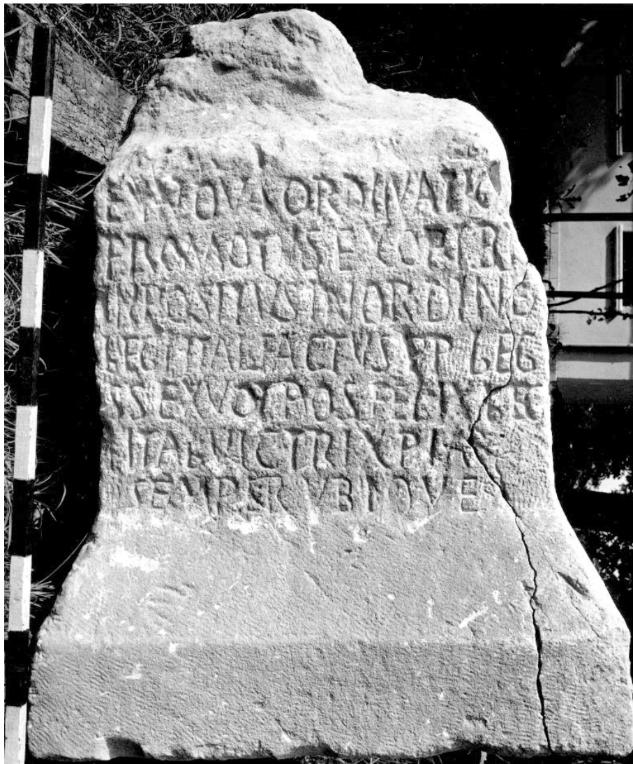
Primus pilus-Inschrift aus Novae