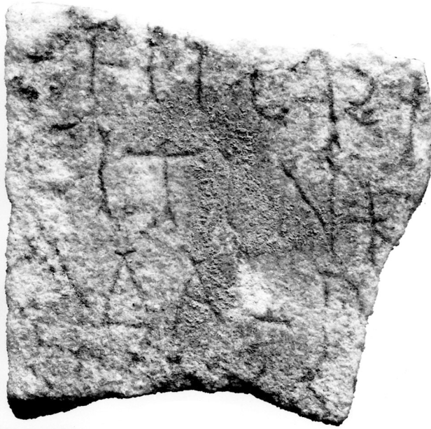
1. Inschriftstein aus Saffig (Landesamt für Denkmalpflege, Abt. Bodendenkmalpflege Koblenz)