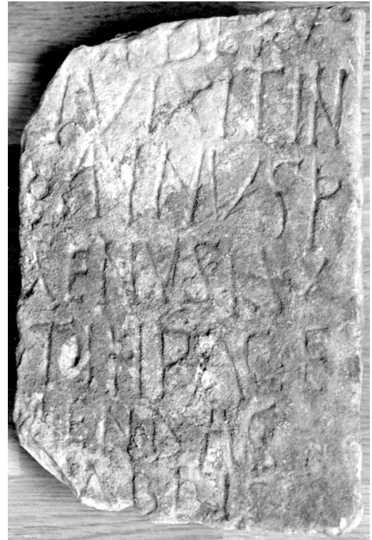
2. Inschriftstein aus Neuwied-Wollendorf (Kreismuseum Neuwied)