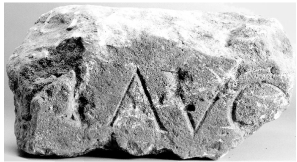
Inschriftstein aus Köln (Römisch-Germanisches Museum Köln)