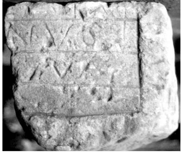
5. Inschriftstein aus Aachen (Museum Burg Frankenberg Aachen)