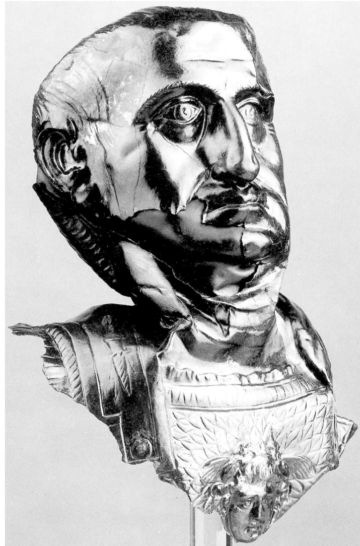
3) Silberne Panzerbüste des Galba. Neapel, Museo Archeologico Nazionale