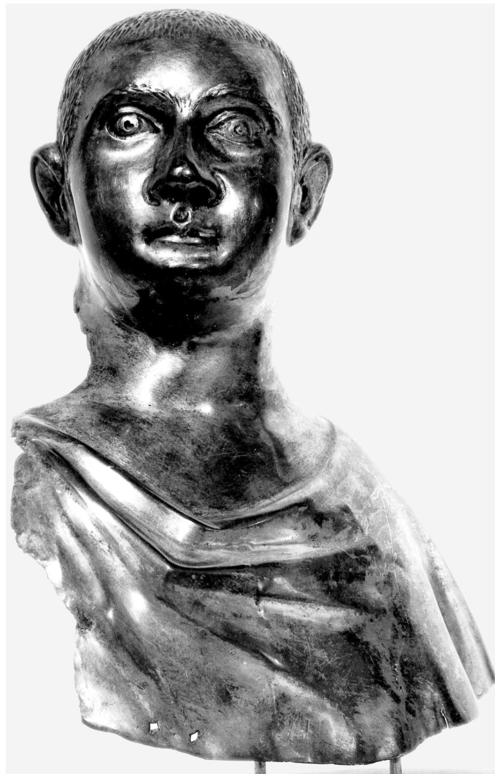
5) Silberne Büste eines Mannes. Parma, Museo Nazionale d' Antichità (DAI Rom Inst. Neg. 67.1658)