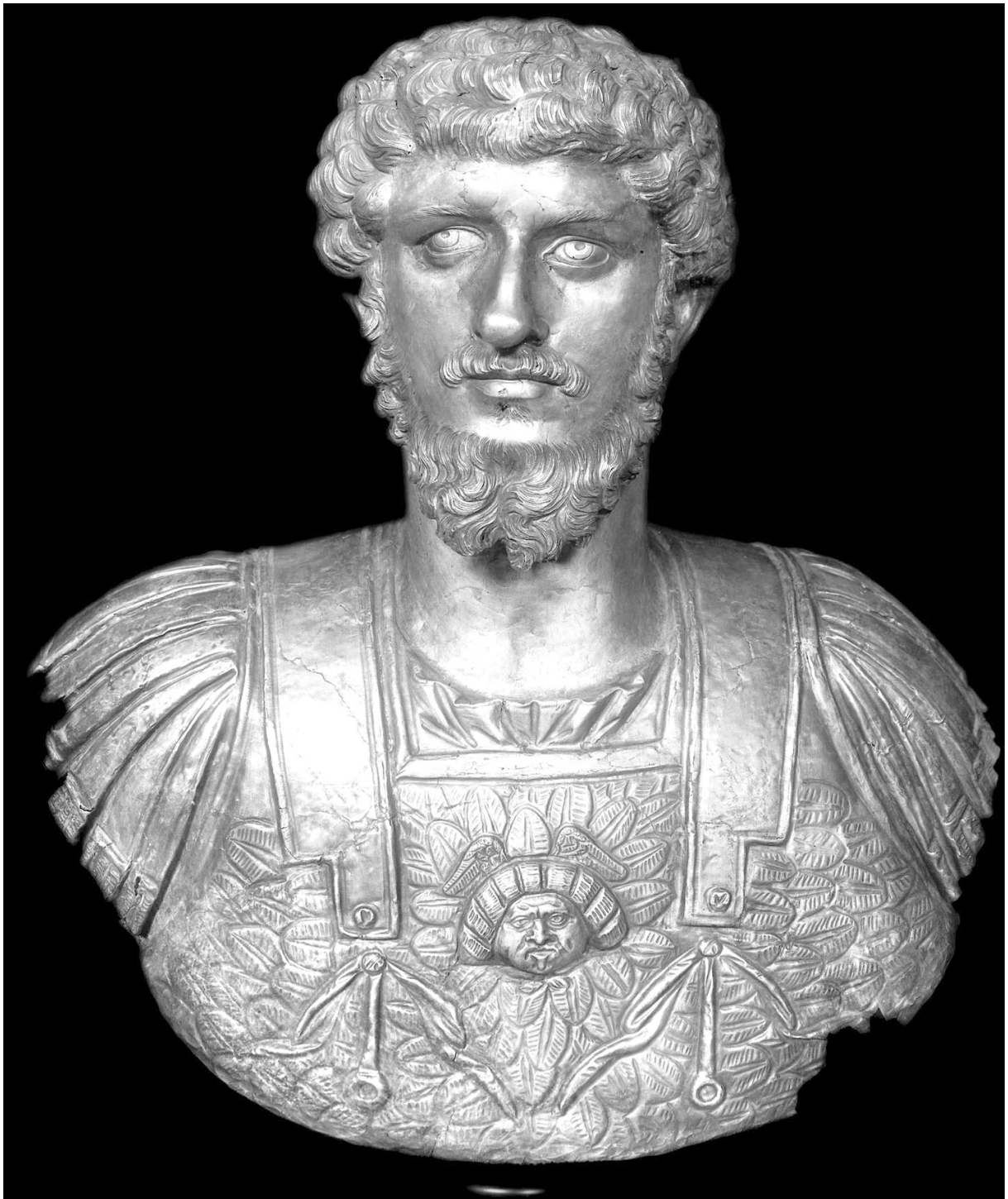
4) Silberne Panzerbüste des Lucius Verus. Turin, Museo d' Antichità G. Lahusen, pp. 251–266