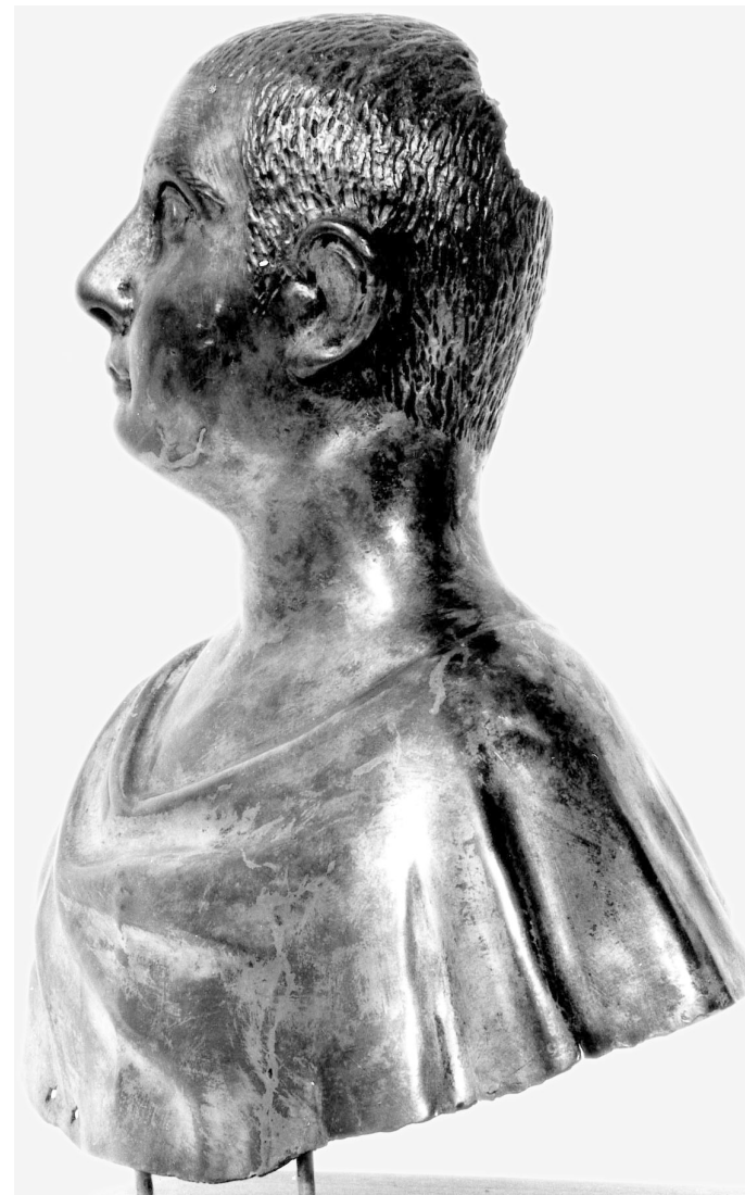
6) Silberne Büste eines Mannes. Parma, Museo Nazionale d' Antichità