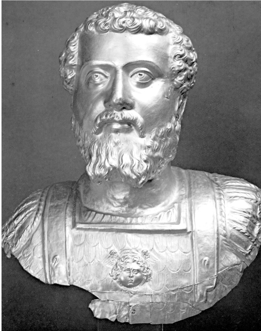
2) Goldene Panzerbüste des Septimius Severus. Komotini, Museum (Photo des Museums)