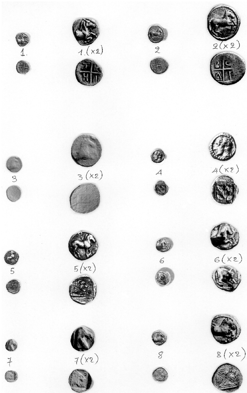
1. ACBNC - 2. ACBNC - 3. Fouilles de Pella - 4. ACBNC - 5. ACBNC - 6. ACBNC - 7. ACBNC - 8. ACBNC