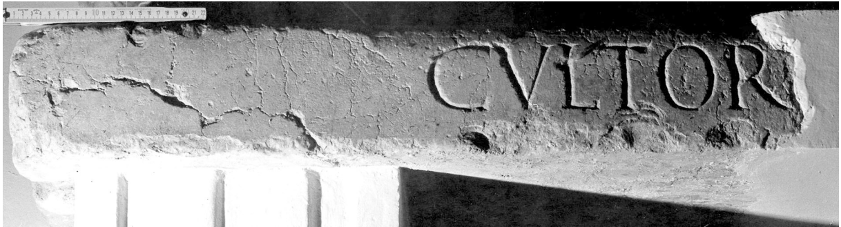
Abb. 1) Inschrift CIL II 3821 = CIL II 2 /14, 293