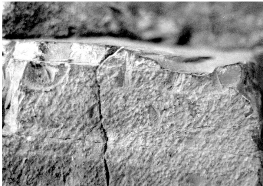
Abb. 3) Detail der Inschrift CIL II 3822 = CIL II 2 /14, 294 G. Alföldy, pp. 275–280